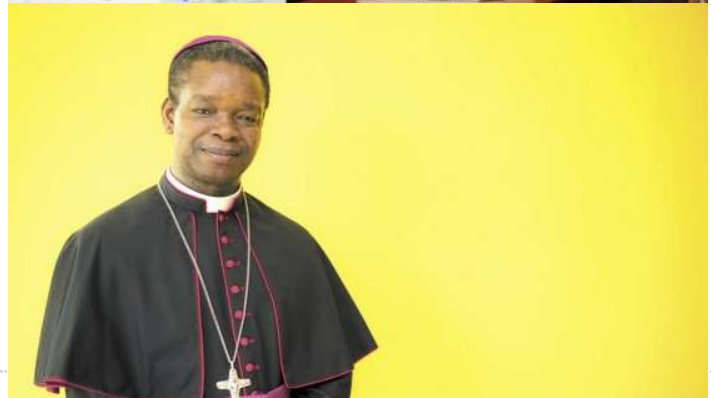
Nuncio Fortunatus Nwachukwu deja Nicaragua